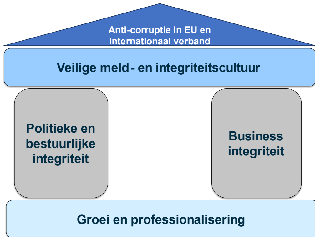
Figuur 1. De vier strategische prioriteiten van TI-NL volgens de 2023-2027 strategie tegen corruptie in internationaal en EU-verband

Dit jaarverslag presenteert de inspanningen en resultaten van TI-NL in relatie tot de inhoudelijke prioriteiten. Aangezien sommige thema's meerdere prioriteiten beslaan, worden die bredere vaak internationale thema's behandeld in het hoofdstuk betreffende de algemene activiteiten van TI-NL in internationaal verband.